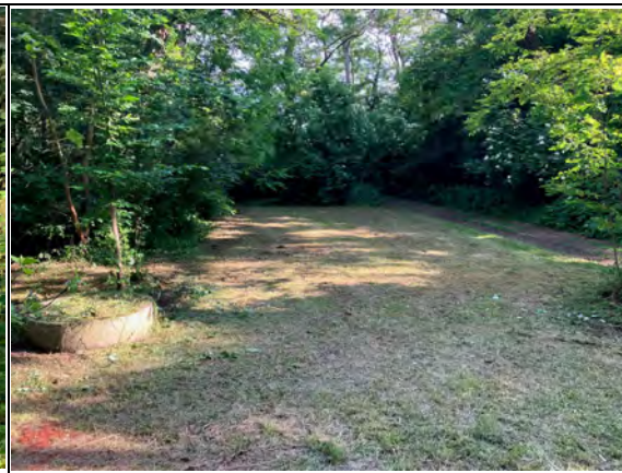
Stellplatzanlage aus Schotterrasen am Weg