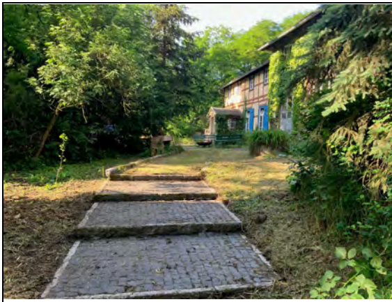
Weg vom Gebäude zu den Stellplätzen

Der Änderungsbereich ist mit dem zweigeschossigen Naturfreundehaus bebaut, das aus dem in Fachwerk errichteten Gebäudeteil aus dem Jahr 1926 und einem massiven Anbau aus der DDR-Zeit besteht. Nördlich davon befindet sich das ehemalige Heizhaus in einem ruinösen Zustand. Vor dem Naturfreundehaus ist ein Vorplatz als Außenanlage für den Aufenthalt der Besucher mit Grillplatz und Feuerschale vorhanden. Von diesem führt ein befestigter Weg mit Stufen nach Süden zur Stellplatzanlage, die sich unmittelbar am Weg befindet. Diese ist mit Schotterrasen ausgeführt. Der Änderungsbereich ist in umgebende Waldbestände so eingebunden, dass die Baumkronen weitgehend die Nutzungen im Luftbild verdecken. Zwischen dem Erschließungsweg und dem Vorplatz sind einzelne Gehölze Kiefer ( Pinus sylvestris ), Robinie ( Robinia pseudoacacia ), Eibe ( Taxus baccata ) und ein Bergahorn ( Acer pseudoplatanus ) vorhanden. Die Gehölze sollen erhalten werden.